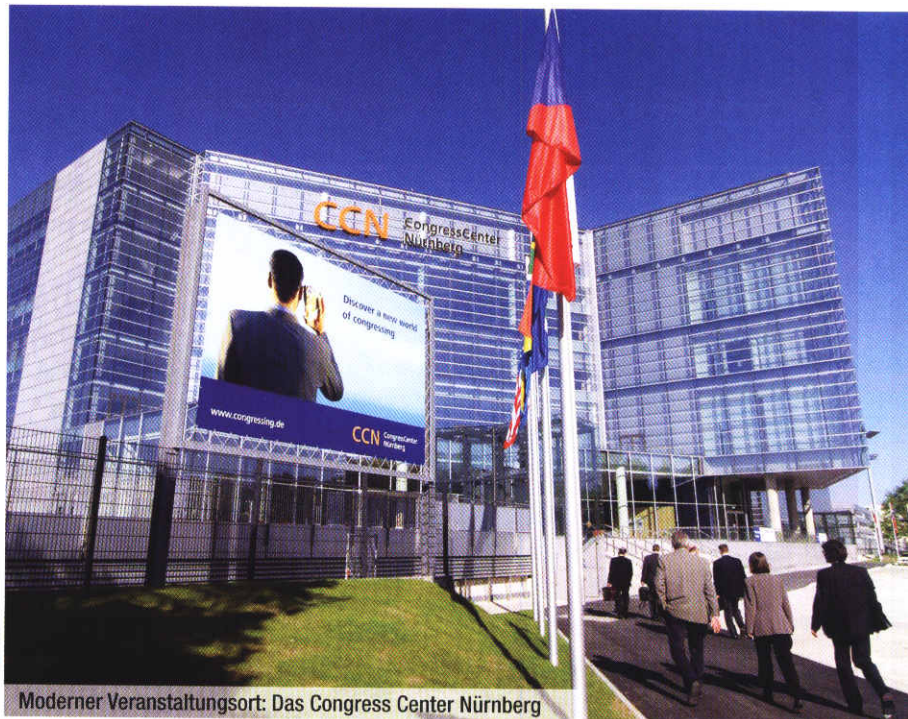
Moderner Veranstaltungsort: Das Congress Center Nürnberg